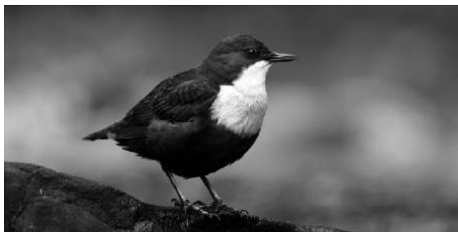
Cincle plongeur

Chaque couple défend un tronçon de rivière. Ils chantent en hiver pour défendre ce territoire, car ils nichent très tôt dès février. Leur nid de mousse en boule se cache souvent sous un pont ou dans un tuyau de drainage.