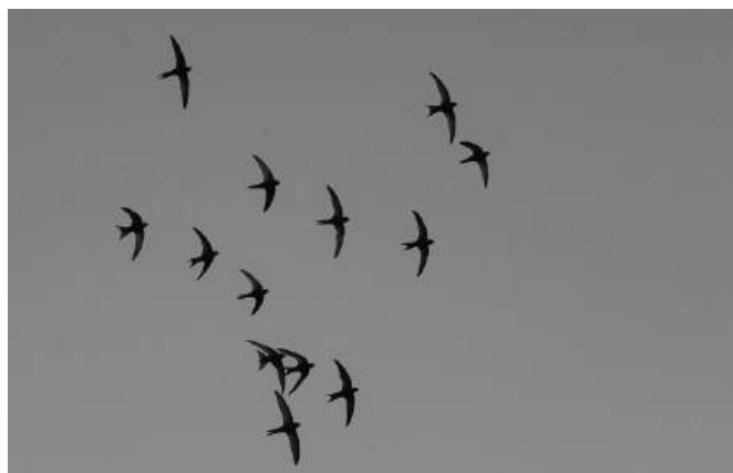
Martinet noir

C'est un migrateur, Il passe l'hiver en Afrique et nous revient fin avril. Au fur et à mesure des rénovations en Basse-Ville, il a perdu les possibilités de nicher et se raréfie. Mais vous pouvez, comme à la rue de la Grand-Fontaine, poser des nichoirs lorsque vous refaites vos toits et façades.