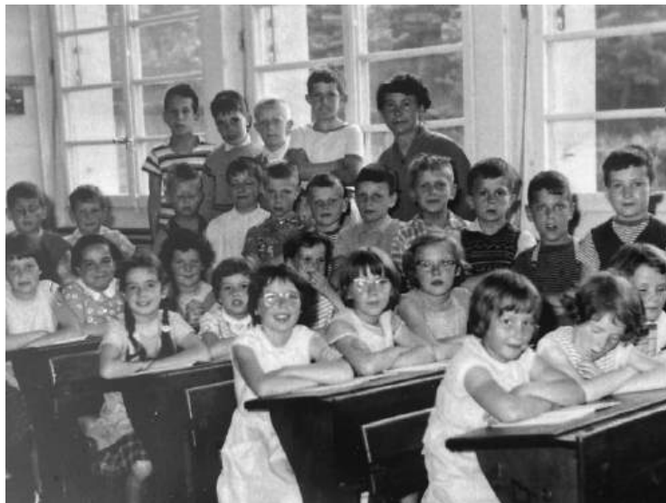
Ecole des Neigles. Années 1959 - 1960

Il y avait 5 boucheries, dont une chevaline, dans le quartier. Des laiteries, fromageries, trois boulangeries, un commerce d'huile et de sel, en-dessus des Tanneurs. Il faut bien se souvenir qu'il y avait 3000 personnes qui vivaient en Auge. Et les gens n'avaient pas de voiture. Tout ce qui est concentrés aujourd'hui dans les supermarchés était à l'époque