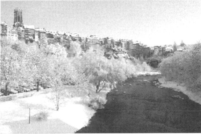
L'hiver à la Neuveville...